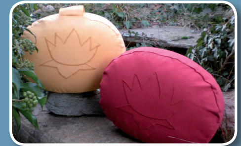
Meditationskissen „oval“ mit Lotusblüte

15 cm höchste Stelle, 45 cm lang, Preis: 21,- EUR