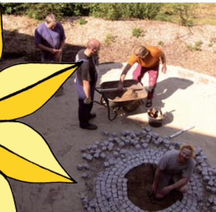
mit Ihrer Hilfe und etwas Geduld...

Die Gartenfreunde Putensen bieten Menschen, die an chronischen psychischen Erkrankungen leiden (gem. §§ 53, 54 SGB XII), ein tagesstrukturierendes Beschäftigungsprogramm an.